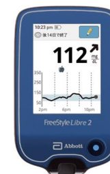
※2 FreeStle リブレリーダー